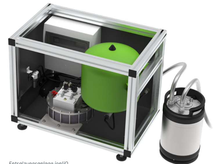
Entsalzungsanlage ionliQ mit Mischbettpatrone desaliQ

Zur Restentsalzung bei Reinstwasseranwendungen (< 0,1 µS/cm) können der Entsalzungsanlage ionliQ zusätzlich Ionenaustauscher nachgeschaltet werden. Diese Kombination hat einen weiteren Vorteil. Durch die Vorentsalzung mittels der ionliQ-Anlage wird die Standzeit dieser Mischbettionenaustauscher signifikant verlängert und die Betriebskosten deutlich reduziert.