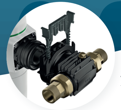
Attacco cliQlock serie pureliQ X