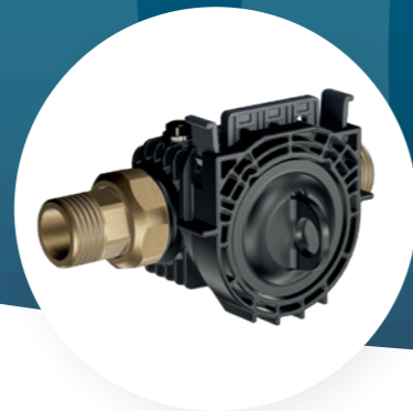
Modulo di base cliQlock con tappo di chiusura e valvola di ritorno integrata